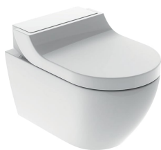
Imagen de ejemplo